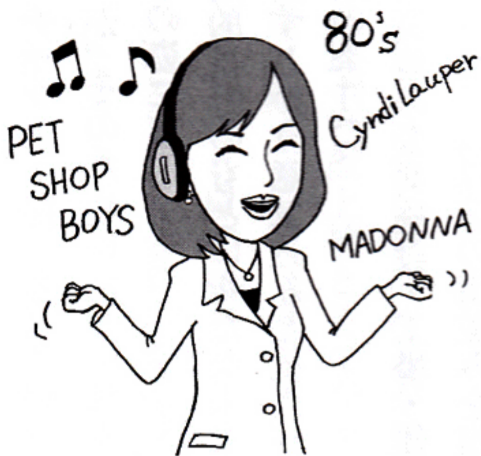
illustration by 広川 ひろし

個人的にはバランスの良い食事を取り、内分泌系の調整のために十分な睡眠を取る、そして食べすぎず適度な運動を心掛けています。また自分の医院で提供するサービスを患者として受けたりもしています。最近では、若くて夢一杯だった80年代の洋楽ポップスを聴き、気持ちを盛り上げて仕事へ行っています。心地良いもの、美しいものに触れることが健康の基本と言えらると思います。